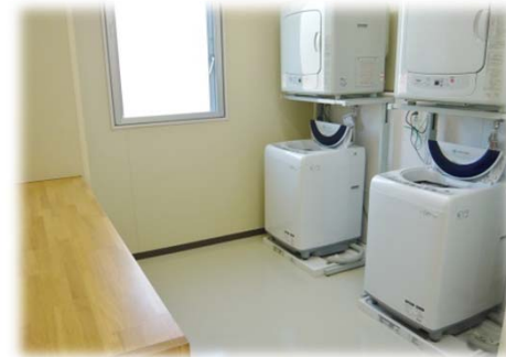
共同洗濯場 (自立の方はご自身でされる方もいらっしゃいます。)