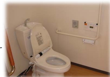
トイレ(ウォシュレット付)