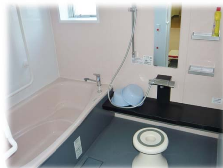
浴槽(3箇所)・・・入居者や家族の希望に合わせて入浴 頻度を対応しております。 特殊浴槽はありませんが、入浴の無い日には、 炭酸湯 を使用した足湯も大変好評いただいております。